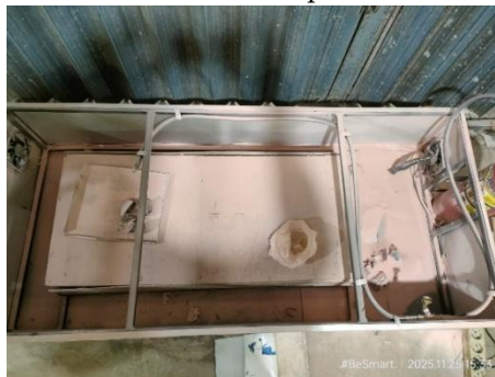
Gambar 6. Hasil pengujian fungsi alat

Pengujian uji fungsi pada Gambar 6. menggunakan bahan pemadam api powder dengan eksperimen tanpa menggunakan nozzle pada setiap output , dengan memberikan dua titik api disetiap output nozzle bahan pemadam mengalir melalui solenoid valve , pipa, dan juga dapat keluar melalui ouput pada nozzle satu namun nozzle kedua tidak dapat mengeluarkan powder karena tekanan tidak merata keluar pada titik nozzle satu sehingga api padam.