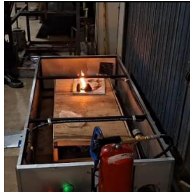
Gambar 4. Pengujian Fungsi Alat

Dengan mengacu pada penelitian sebelumnya (supri, 2023) bahwa efektivitas bahan pemadam menjadi tantangan utama. Penggunaan eksperimen pada penelitian ini meskipun unggul secara sifatnya yang non-konduktif, dari hasil penelitian menunjukan keterbatasan teknis yang signifikan pada bagian nozzle . Hasil pengujian pada TABEL 6 menunjukan bahan powder menyebabkan penyumbatan pada nozzle spray . Beda dengan media air dan gas mengalir sempurna.