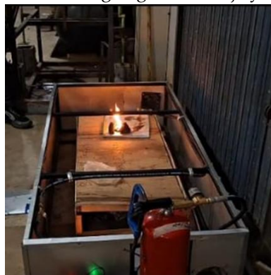
Gambar 3. Hasil pembuatan prototype

Pada gambar yang ditunjukkan oleh Gambar 3. merupakan hasil pembuatan prototype , pembuatan prototype dibuat melewati beberapa proses manufaktur sesuai dengan gambar kerja yang telah dibuat pada proses perancangan.