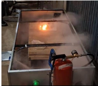
Gambar 5. Proses pengujian fungsi alat

powder yang padat sehingga nozzle tidak dapat mengeluarkan powder dan tidak dapat memadamkan pada area titik api.